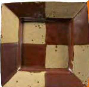
6《柿釉抜絵 角皿》 1950年