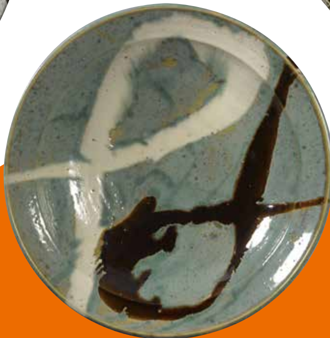
7《青釉白黒流描 大鉢》 1951年頃