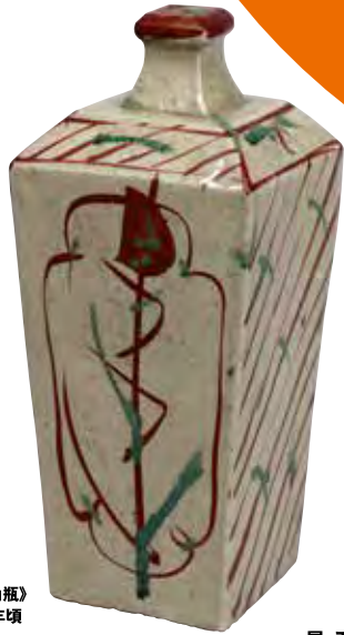
3《赤絵 角瓶》 1956年頃