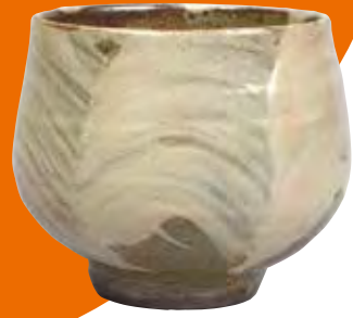
1《刷毛目 茶碗》 1935年

濱田庄司(1894-1978)は1924年に栃木県益子に拠点を置き、沖繩や英国などの工芸を吸収しながら、作品を展開していきました。また、柳宗悦(1889-1961)や河井寛次郎(1890-1966)とともに民藝運動を推進し、自身の作陶においても、実用性を重視した作品を手仕事により数多く生み出しました。シンプルで重みのある形に大胆かつ軽やかな釉掛けが施された作品には、個人作家としての濱田の個性が見られます。これらの作品は高い評価を受け、1955年に第1回重要無形文化財保持者(人間国宝)に認定されました。