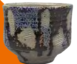
8《塩釉御目色差 茶碗》 1961年