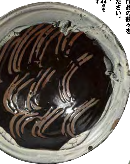
4《掛分指描 大鉢》 1943年